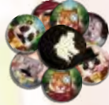
۲۷ کارت «مظنون»